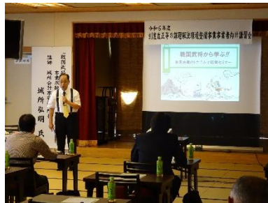
戦国武将の例を基にしたお話は、大変分かりやすかったと好評であった。

小規模事業者経営改善資金融資制度（以下マル経融資制度）は小規模事業者が、経営に必要な事業資金を商工会の推薦により、日本政策金融公庫より無担保・無保証人で融資を受ける事が可能な融資制度となっております。 今回、マル経融資制度創設50周年を迎えるに当たり本制度の普及と推進に関し、日本政策金融公庫仙台支店井上健仙台支店長より感謝状を授与頂きました。