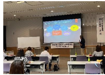
とても分かりやすく、不安が解消されたとの声が多く聞かれた。

もと夢いちごの郷前で施設を訪れたお客様に対し、チラシとマスクを配布し交通安全に努めていただけでなく呼びかけを行いました。女性部では今後も、部員同士の交流や地域発展に寄与すべく事業を実施して参る所存です。